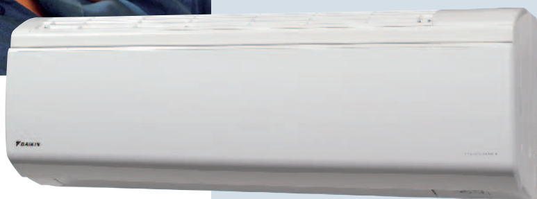
Вътрешно тяло FTXR