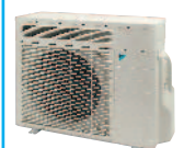
RXR 28, 42, 50 E