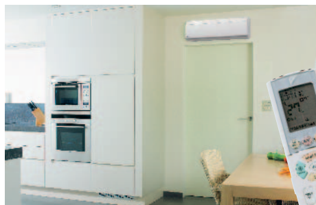
Вътрешно тяло FTXR 28, 42, 50 E