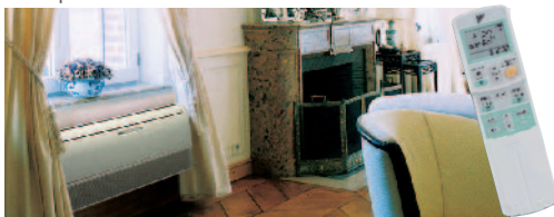
Външно тяло RKS/RXS 25, 35 G